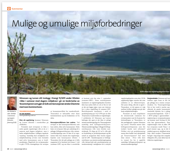
32 | www.energi-nett.no

Så til Tesse-revisjonen: Mobæk spør oss: hvordan vi mener fyllingsrestriksjonene i Tesse burde vært utformet, hvilket produksjonstap mener vi ville vært akseptabelt, og