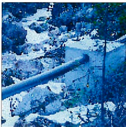
Uttak av vann til minikraftverk må vurderes etter vannressursloven. Utbygging som berører nevneverdige allmenne interesser må ha tillatelse etter vannressursloven.

Plan- og bygningsloven har bestemmelser om planlegging og behandling av saker om bygge- og anleggsarbeider. Alle tiltak må avklares i forhold til kommuneplanens arealdel eller reguleringsplan for området. Tiltak som er gitt konsesjon etter vannressursloven eller vassdragsreguleringsloven er unntatt fra plan- og bygningslovens byggesaksbehandling, men lovens øvrige deler gjelder.