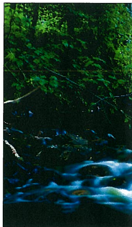
To noenlunde like vassdrag, med og uten kant

Mindre vassdragsinngrep vil ofte ikke kreve tillatelse etter vannressursloven. Det vil da være tilstrekkelig med behandling som byggesak. Uvesentlige terrenginngrep trenger heller ikke byggetillatelse. For større tiltak, f.eks. flomverk eller masseuttak, kan det på den annen side være nødvendig med reguleringsplan, eventuelt dispensasjon fra gjeldende plan. Ved behandling av byggesøknad vil det være krav til ansvarlig søker og ansvarlig prosjekterende, på samme måte som for andre byggesaker. Søknaden avgjøres av kommunen.