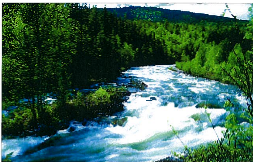
Atnavassdraget, sideelv til Glomma, Hedmark. Vassdraget er vernet.

Denne og annen informasjon kan hentes fra våre nettsider, www.nve.no , eller fås tilsendt ved henvendelse til NVE.