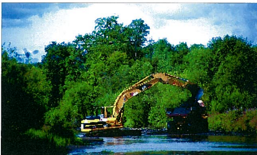
Grusuttak i vassdrag er et inngrep som ofte har negative virkninger for almenne interesser. Det må derfor vurderes etter vannressursloven, i tillegg til plan- og bygningsloven

Det er nødvendig å vurdere hver sak i forhold til de relevante lovene. Kommunen, fylkesmannen eller NVEs regionkontor kan gi råd og veiledning om hvordan en skal gå fram, og hvem som må kontaktes. Ta tidlig kontakt med